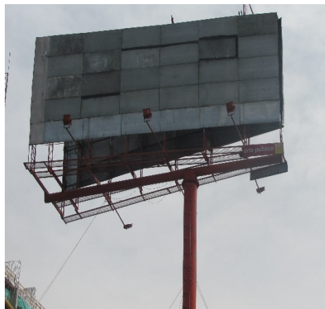
Foto 2. Texto de la Publicidad